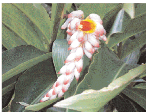
Alpinia zerumbet (Zingibéracées) A tous maux, Lavann blanc

Inscriptions et informations sur : www.aplamedarom.fr